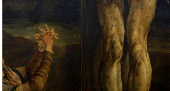
10. Extreme Close Up van de benen van Christus en vermoedelijk de handen van Pilatus