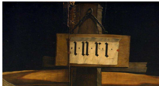
9. Eerste Extreme Close Up shot van hoofdstuk twaalf met vermoedelijk de sterfdag van Christus

Wat opvalt is dat wanneer de voice-over de zin uitspreekt “Both are son of God” heel duidelijk nog de kerk van de binnenkant, en het glas-in-lood op de achtergrond te zien is. Het lijkt de bedoeling van de documentairemaker om hier het goddelijke te accentueren. Vervolgens spreekt de voice-over de zin uit: “Both die on the same date, the fifteenth of March and the fifteenth of Nisan.” Op het moment dat het woord die wordt uitgesproken is het beeldscherm gevuld met het schilderij van de kruisiging. Het lijkt alsof hiermee geprobeerd wordt het ‘doden’ meer kracht bij te zetten. Op het moment dat de voice-over “...fifteenth of March and the fifteenth of Nisan.” uitspreekt verandert het shot van een Total Shot (TS) naar een Extreme Close Up (ECU). En wel op een gedeelte van het schilderij waar, zo lijkt het, de sterfdatum van Jezus wordt getoond (afbeelding 9).