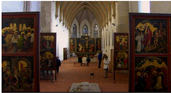
7. Eerste shot ( Very Wide Shot ) uit hoofdstuk twaalf

over al begonnen met zijn verhaal. Door het inzoomen wordt de aandacht op het schilderij versterkt. Het schilderij is belangrijk omdat dit het verhaal van de voice-over aanvult en versterkt.