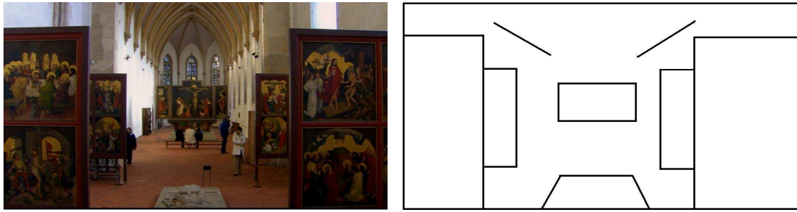
13. Compositie van de eerste scène van hoofdstuk 12

In de scène uit hoofdstuk 13 met Francesco Carotta is een ander voorbeeld van composition te zien. In plaats van het gebruik van lijnen, is hier de compositie opgesteld door middel van het verschil tussen voorgrond en achtergrond. Om dit verschil tussen voorgrond en achtergrond te versterken is het contrast in licht gecreëerd. De voorgrond is goed belicht, de achtergrond is donker en nauwelijks te zien. Carotta staat in deze scène centraal.