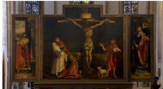
8. Het totaalshot van het schilderij

Wat opvalt is dat wanneer de voice-over de zin uitspreekt “Both are son of God” heel duidelijk nog de kerk van de binnenkant, en het glas-in-lood op de achtergrond te zien is. Het lijkt de bedoeling van de documentairemaker om hier het goddelijke te accentueren. Vervolgens spreekt de voice-over de zin uit: “Both die on the same date, the fifteenth of March and the fifteenth of Nisan.” Op het moment dat het woord die wordt uitgesproken is het beeldscherm gevuld met het schilderij van de kruisiging. Het lijkt alsof hiermee geprobeerd wordt het ‘doden’ meer kracht bij te zetten. Op het moment dat de voice-over “...fifteenth of March and the fifteenth of Nisan.” uitspreekt verandert het shot van een Total Shot (TS) naar een Extreme Close Up (ECU). En wel op een gedeelte van het schilderij waar, zo lijkt het, de sterfdatum van Jezus wordt getoond (afbeelding 9).