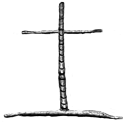
Fig. 11: Tropeo, ritagliato.