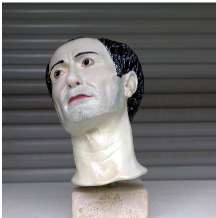
Fig. 13: L'effigie in cera di Cesare, in vista principale. 10