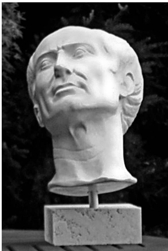
Fig. 9: Vista principale del ritratto tuscolano di Cesare. 6