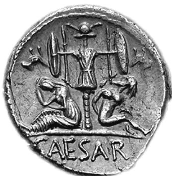
Fig. 10: Trofeo su una moneta di Cesare, con le spoglie appesevi.