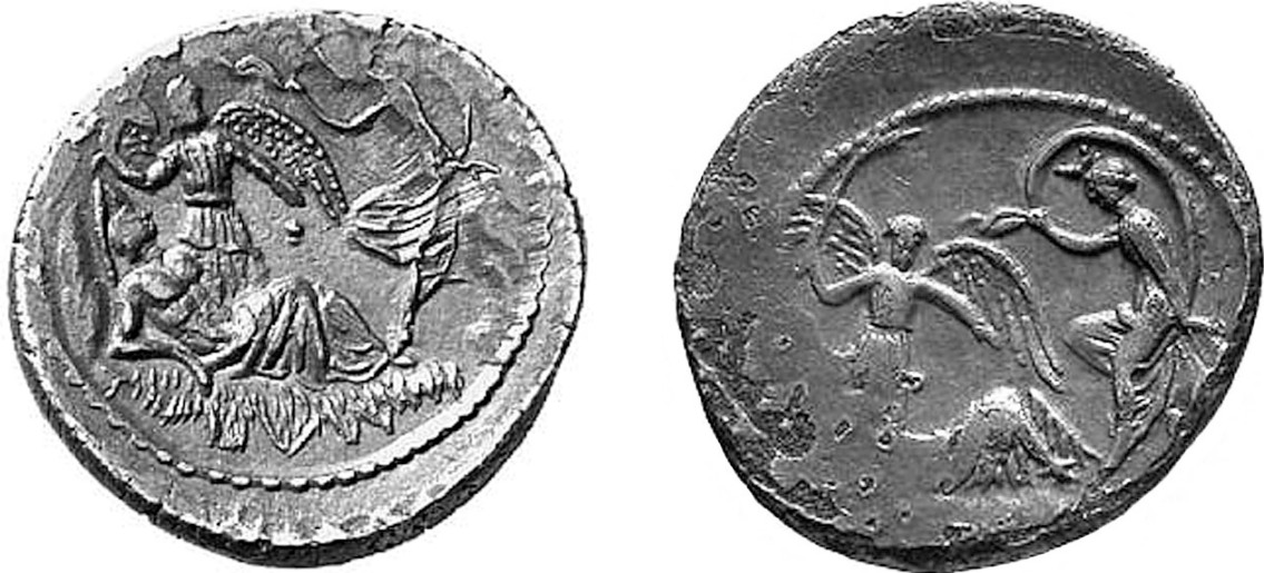
Fig. 7, 8: Monete cesariane del Buca.