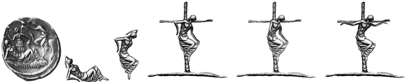
Fig. 12, 12a, 12b, 12c, 12d, 12e: Cesare-Memnone/Endimione dal denario del Buca, ritagliato e posto sul tropeo. 8

A tale vista insopportabile il popolo si infuriò, diede la caccia agli assassini, linciò coloro che riuscì ad afferrare, al chè i rimanenti fuggirono dalla città. Vittoria postuma dell'ucciso Cesare, la sua resurrezione imposta dal popolo – per il nostro teologo: la Pasqua storica.